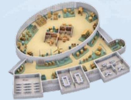
GEC - German Energy Center in Jinan (China)